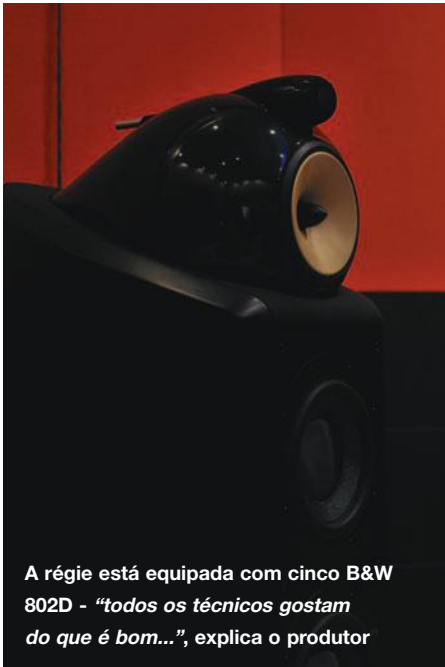
A régie está equipada com cinco B&W 802D - “todos os técnicos gostam do que é bom...”, explica o produtor

1 de Maio de 1978. Mas foi em Évora que passou a maior parte da sua infância e juventude, onde desde muito novo se sentiu atraído pela poesia e pela música.